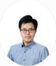
영어영역 정상화 선생님